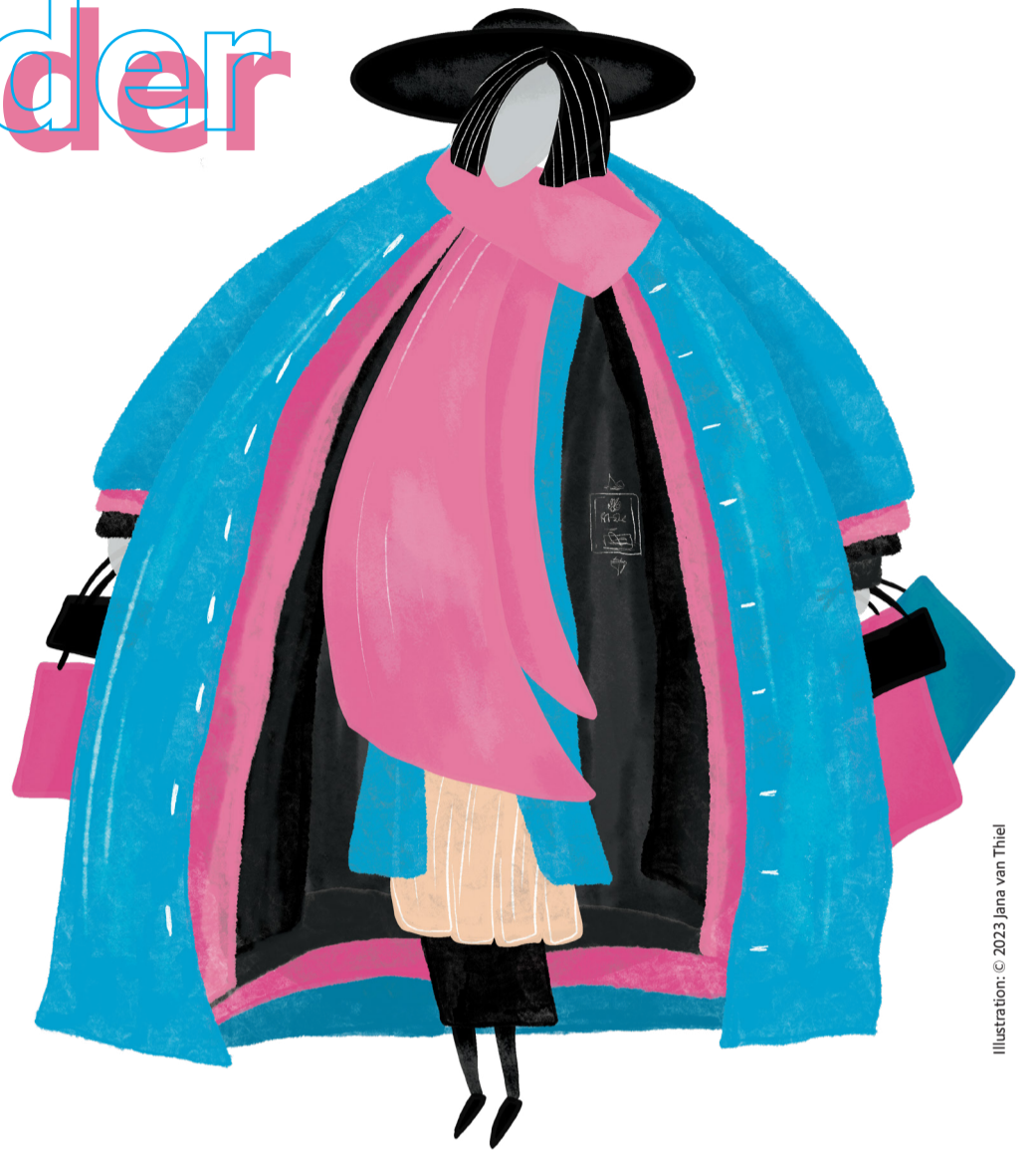
Illustration: © 2023 Jana van Thiel